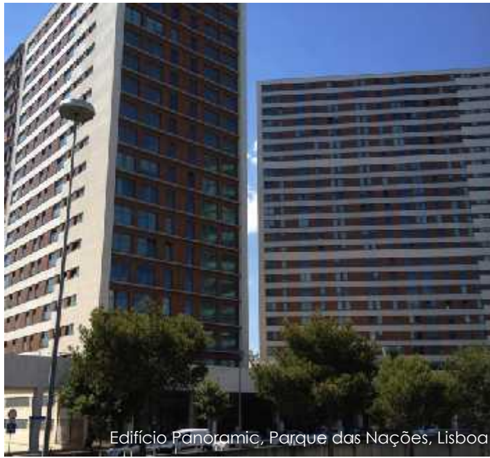
Edifício Panoramic, Parque das Nações, Lisboa