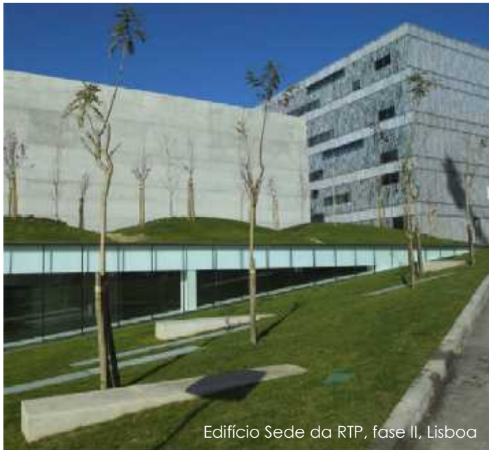
Edifício Sede da RTP, fase II, Lisboa