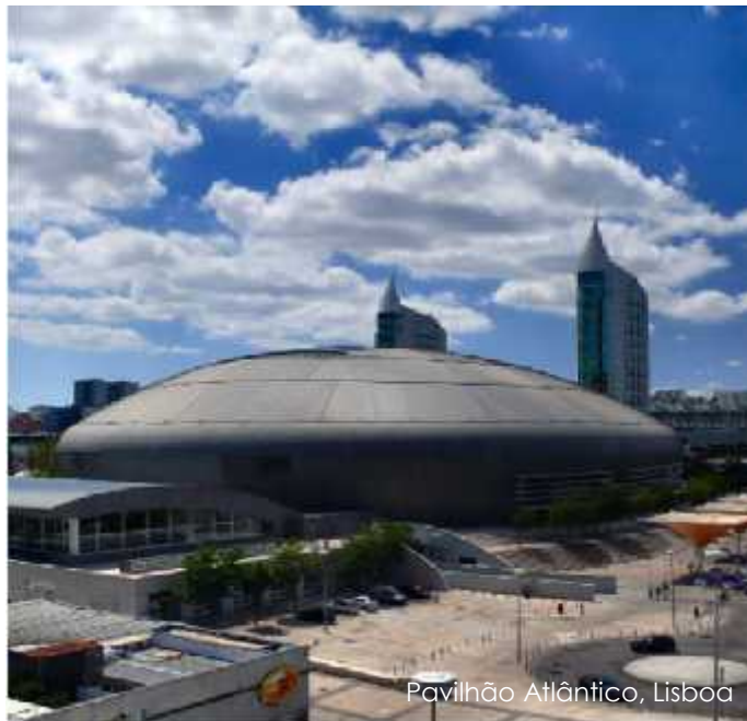
Pavilhão Atlântico, Lisboa