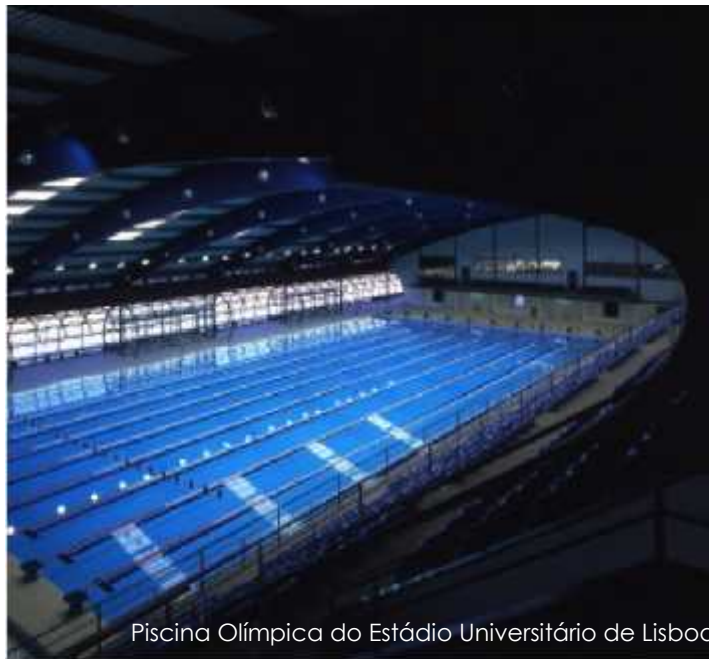
Piscina Olímpica do Estádio Universitário de Lisboa