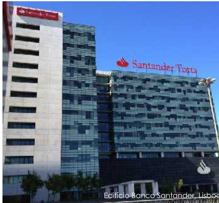
Edifício Banco Santander, Lisboa