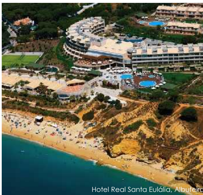
Hotel Real Santa Eulália, Albufeira