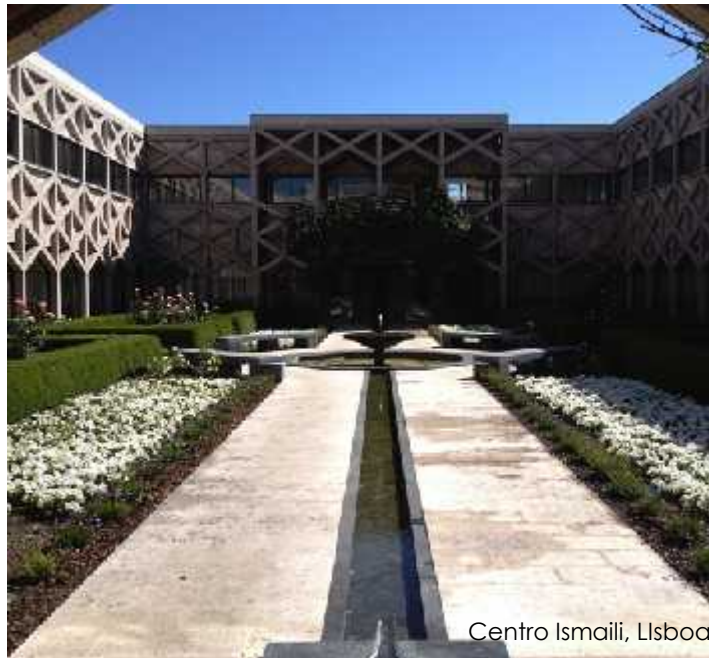
Centro Ismaili, Lisboa