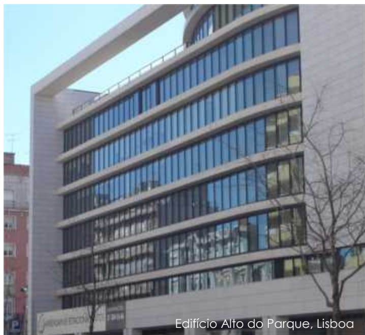
Edifício Alto do Parque, Lisboa