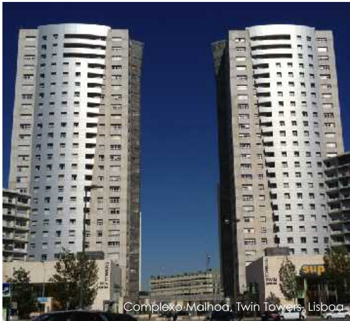
Complexo Malhoa, Twin Towers, Lisboa