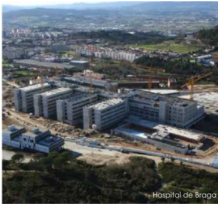
Hospital de Braga