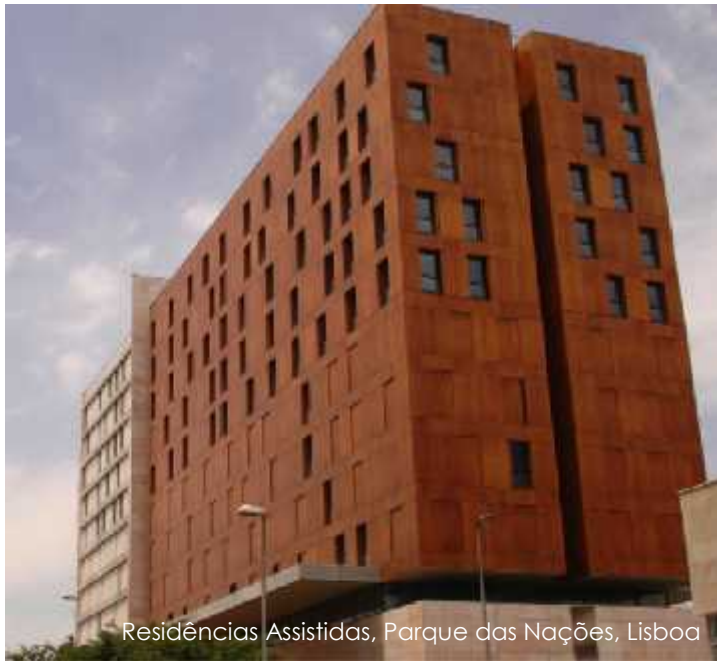
Residências Assistidas, Parque das Nações, Lisboa