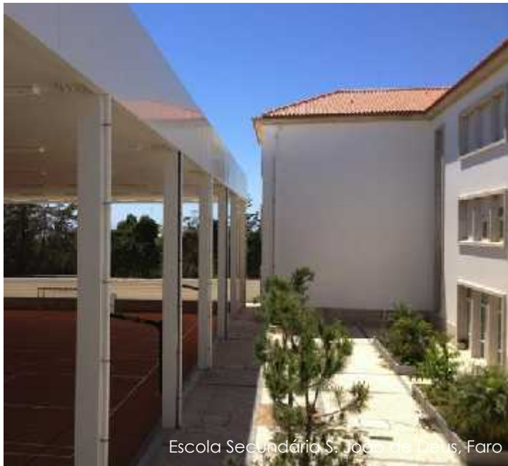
Escola Secundária S. João de Deus, Faro