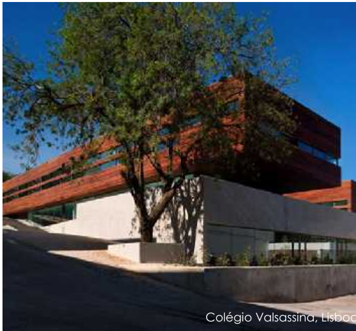
Colégio Valsassina, Lisboa