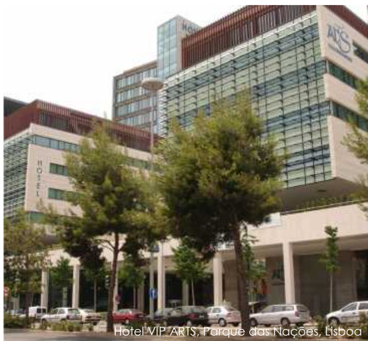
Hotel VIP ARTS, Parque das Nações, Lisboa