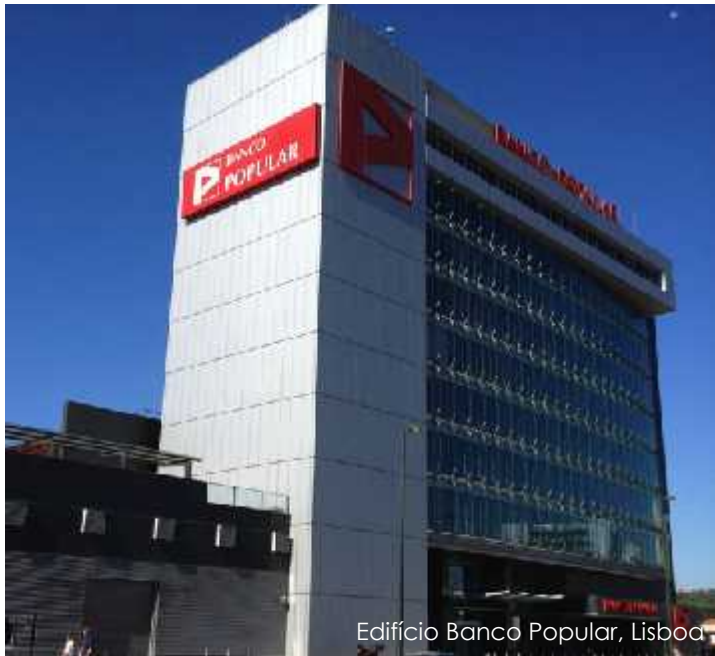
Edifício Banco Popular, Lisboa